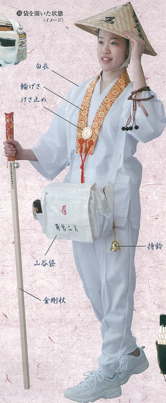
白衣 輪げさ けさ止め 山谷袋 金剛杖 持鈴